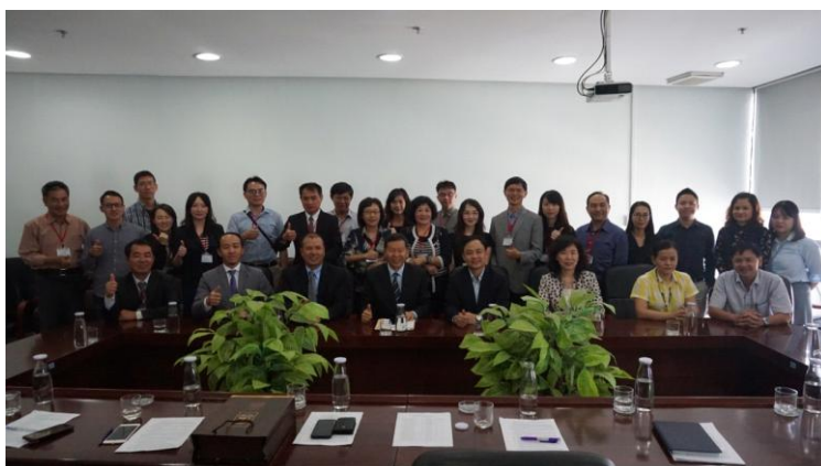
本會考察團成員與峴港市旅遊局出席代表及與人員合影留念