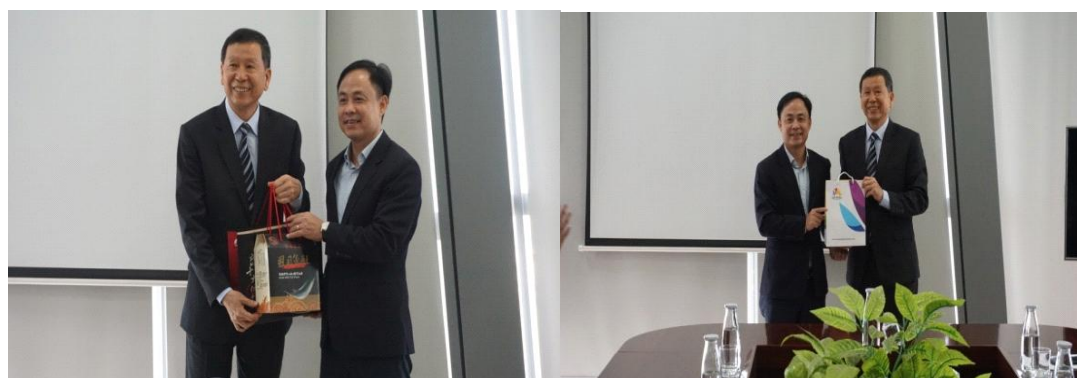
汪副秘書長(左)致贈伴手禮