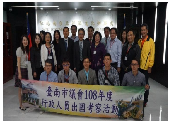
本會考察團成員於辦事處大廳前合影