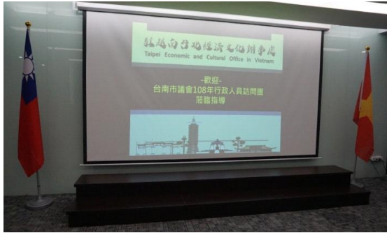
辦事處歡迎本會考察團蒞臨字幕