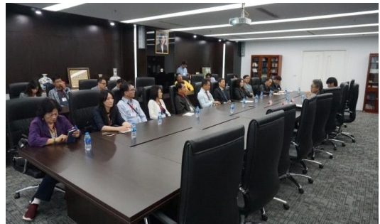
本會考察團與辦事處代表進行交流