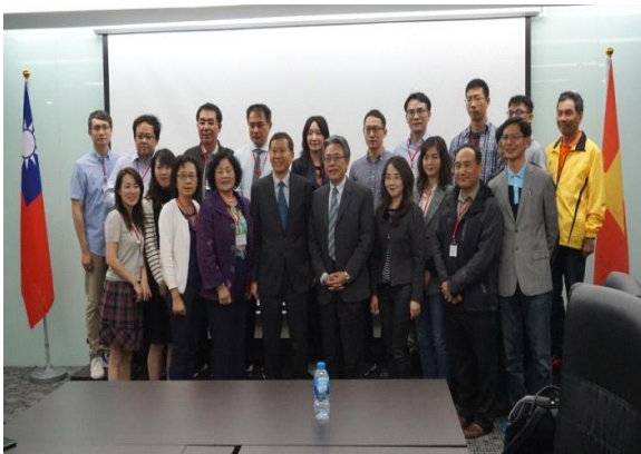
本會考察團成員與辦事處代表合影