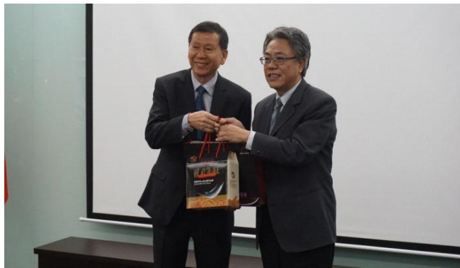
汪副秘書長(左)致贈伴手禮