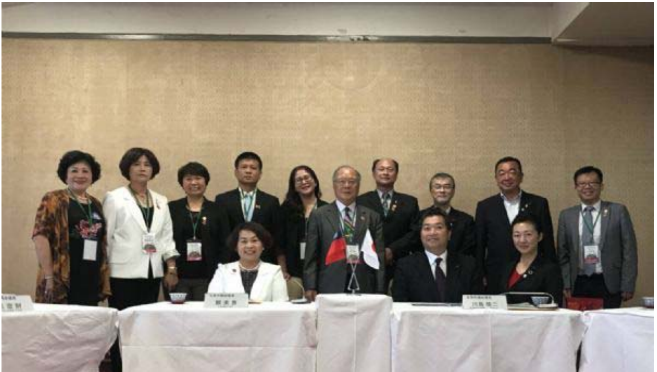
在日本 311 大地震和台南 0206 地震，台灣和日本透過一次次的震災援助，也累積深厚的友誼。

聯盟成員」，提升國際能見度，透過各種活動的參與，期許臺南市與滋賀縣未來有更多的交流合作，友誼長青，期待早日再相會。