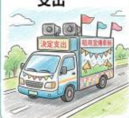
(三) 租用宣傳車輛支出